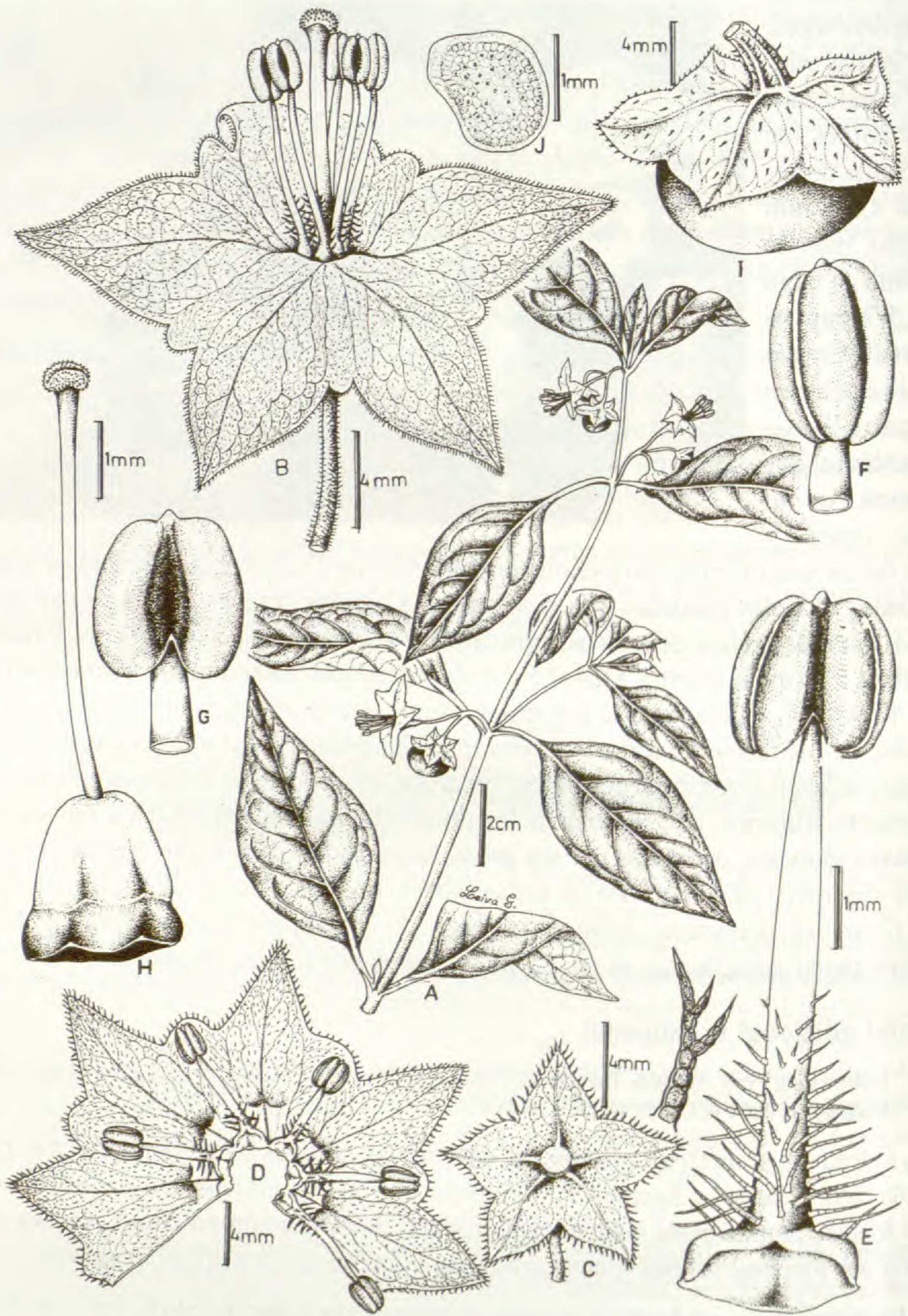
Fig. 1. Jaltomata aypatensis Leiva, Mione & Quipuscoa: A. Rama florífera; B. Flor; C. Cáliz; D. Corola desplegada; E. Estambre (vista ventral); F. Estambre (vista lateral); G. Estambre (vista dorsal); H. Gineceo; I. Baya; J. Semilla. (del. de S. Leiva, N. Sawyer & V. Quipuscoa 2024, HAO).